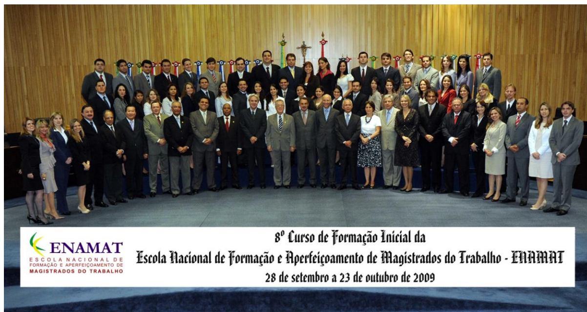
Foto Oficial do 8º Curso de Formação Inicial

De 28 de setembro a 23 de outubro de 2009