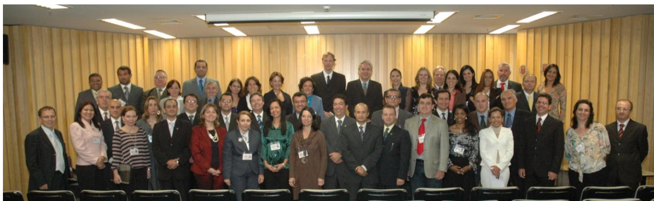
Encerramento do 1º Curso de Formação de Formadores em Administração Judiciária em Vara do Trabalho