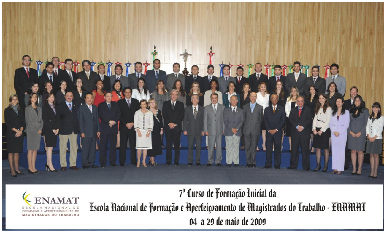
Foto Oficial do 7º Curso de Formação Inicial