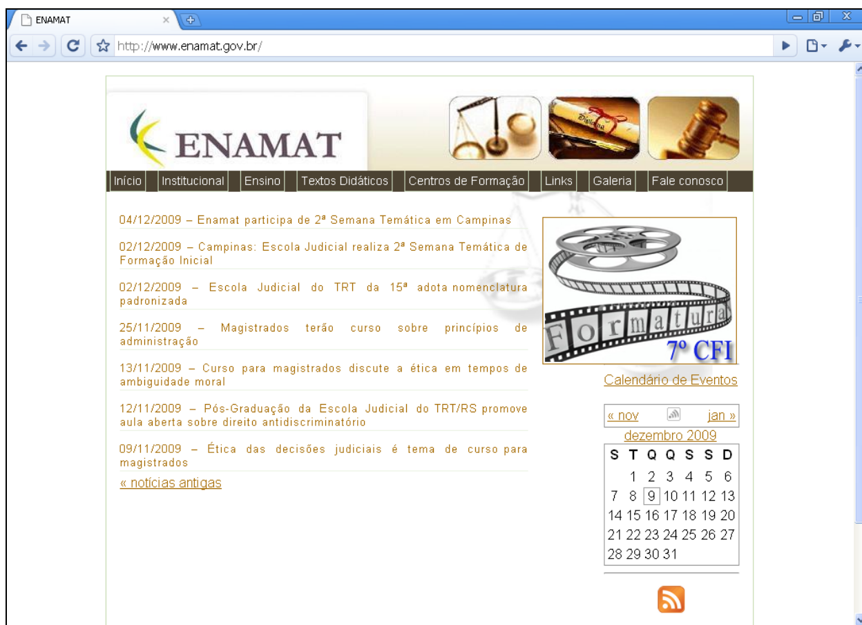
Figura: Novo website da ENAMAT

A Escola Nacional de Formação e Aperfeiçoamento de Magistrados do Trabalho realizou, em 2009, três eventos com transmissão pela internet.