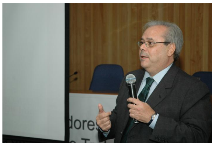
Desembargador Flávio Portinho Sirangelo - TRT da 4ª Região