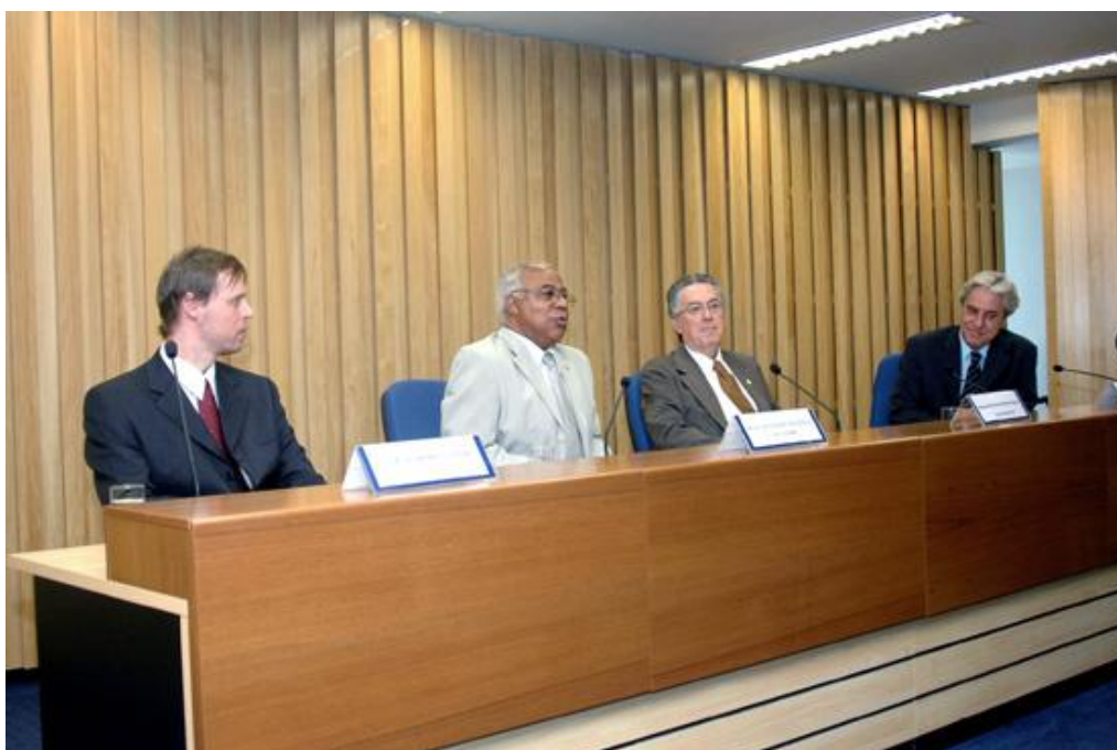
Encerramento do Curso