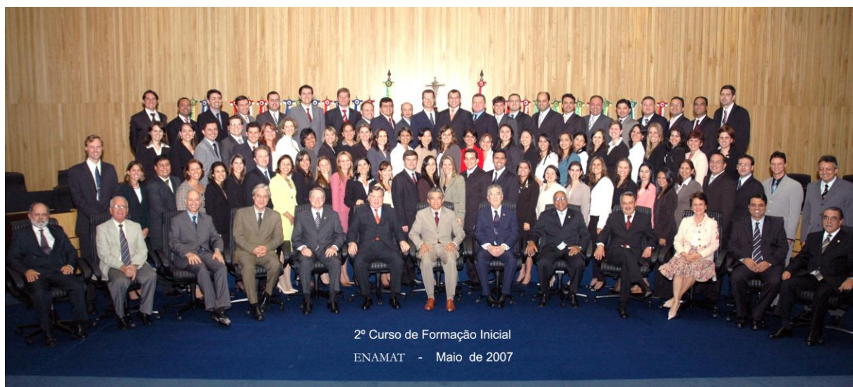
Foto Oficial do 2º Curso de Formação Inicial